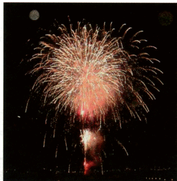
【30周年記念花火】